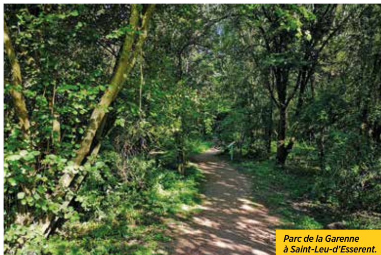
Parc de la Garenne à Saint-Leu-d'Esserent.