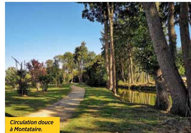
Circulation douce à Montataire.