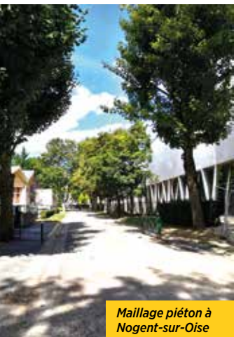
Maillage piéton à Nogent-sur-Oise

Un large panel de représentants de la vie locale avait été convié à ces échanges : habitants, techniciens, élus, associations (pêcheurs, environnement, chasseurs, cyclistes, randonneurs, patrimoine, conseils de quartier), sans compter les membres du conseil de développement de l'ACSO, très impliqués dans ces réunions.