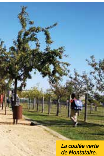
La coulée verte de Montataire.