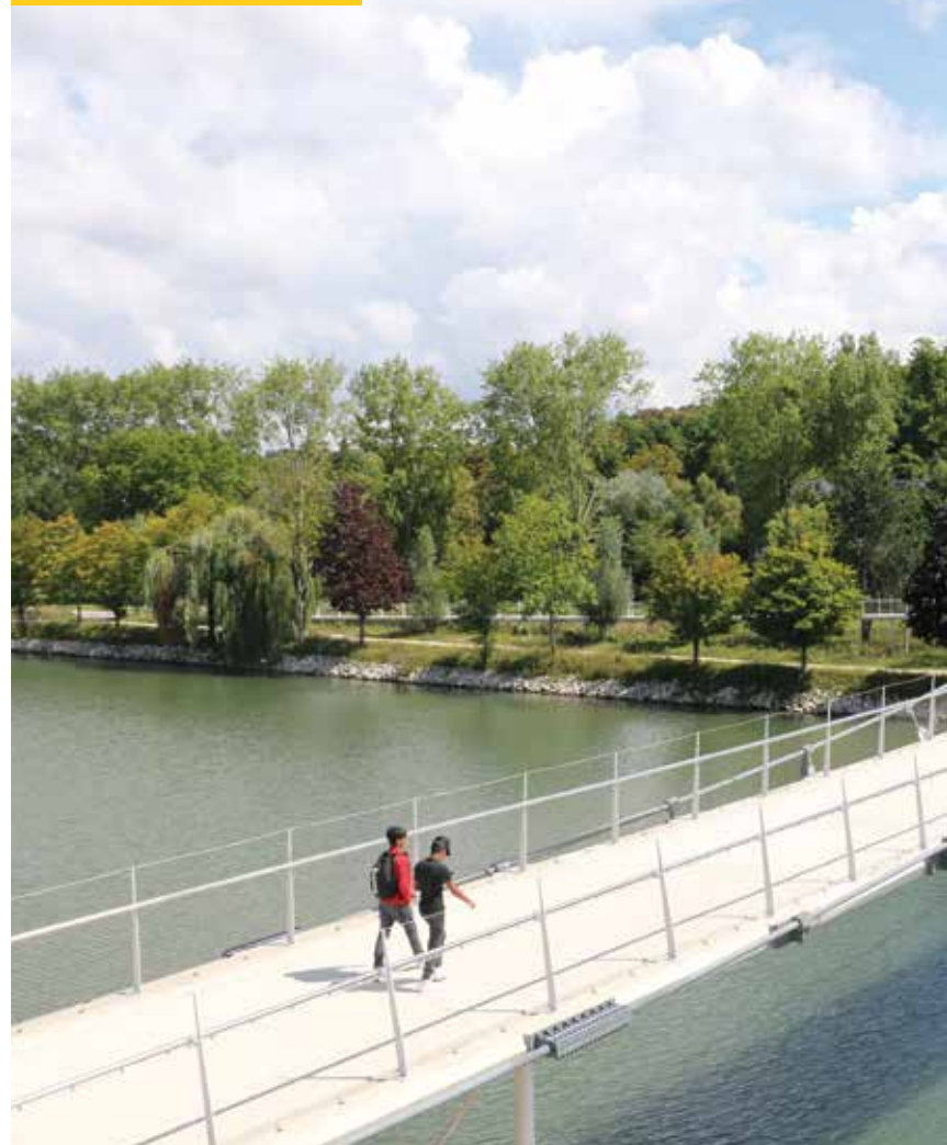
À Creil, la passerelle Nelson-Mandela illustre l'intégration réussie d'un ouvrage d'art dans le paysage.

L'objectif est d'établir des liens avec les espaces plus modestes (tissus pavillonnaires, trames urbaines historiques, secteurs de nature discrète comme les ruisseaux, jardins familiaux, zones de maraîchage, etc.) pour éviter le phénomène de rupture radicale d'échelles d'activités humaines.