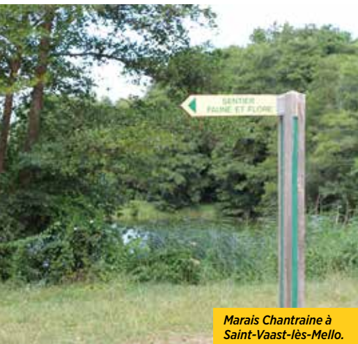
Marais Chantraine à Saint-Vaast-lès-Mello.

LA PIERRE , particularité majeure et repère visuel fort du territoire: l'Oise regorge de carrières désaffectées pouvant être réinvesties par des activités agricoles alternatives (maraîchage, verger, pastoralisme), de loisirs de plein air (équitation, escalade, accrobranche, etc.) ou touristiques. Les anciens fronts de taille qui jalonnent également le territoire constituent un autre levier de mise en valeur de la pierre. Quant au matériau lui-même, il peut être utilisé pour des aménagements de stationnement ou encore comme signalétique.