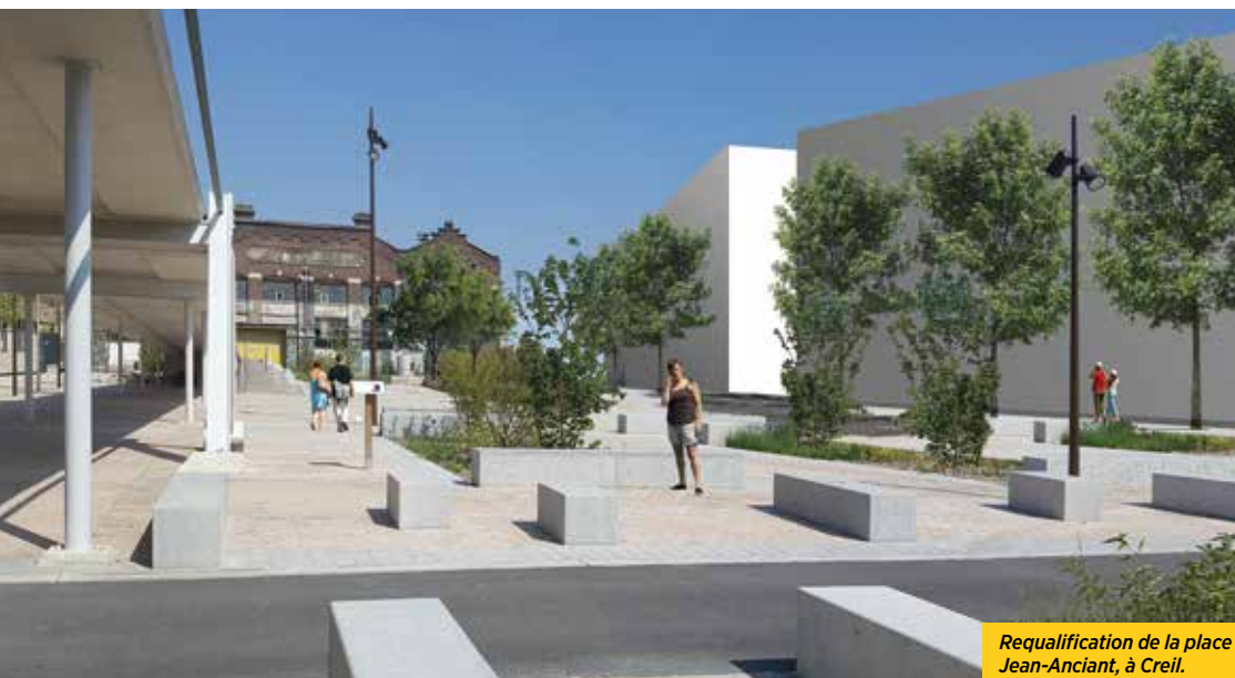
Requalification de la place Jean-Anciant, à Creil.